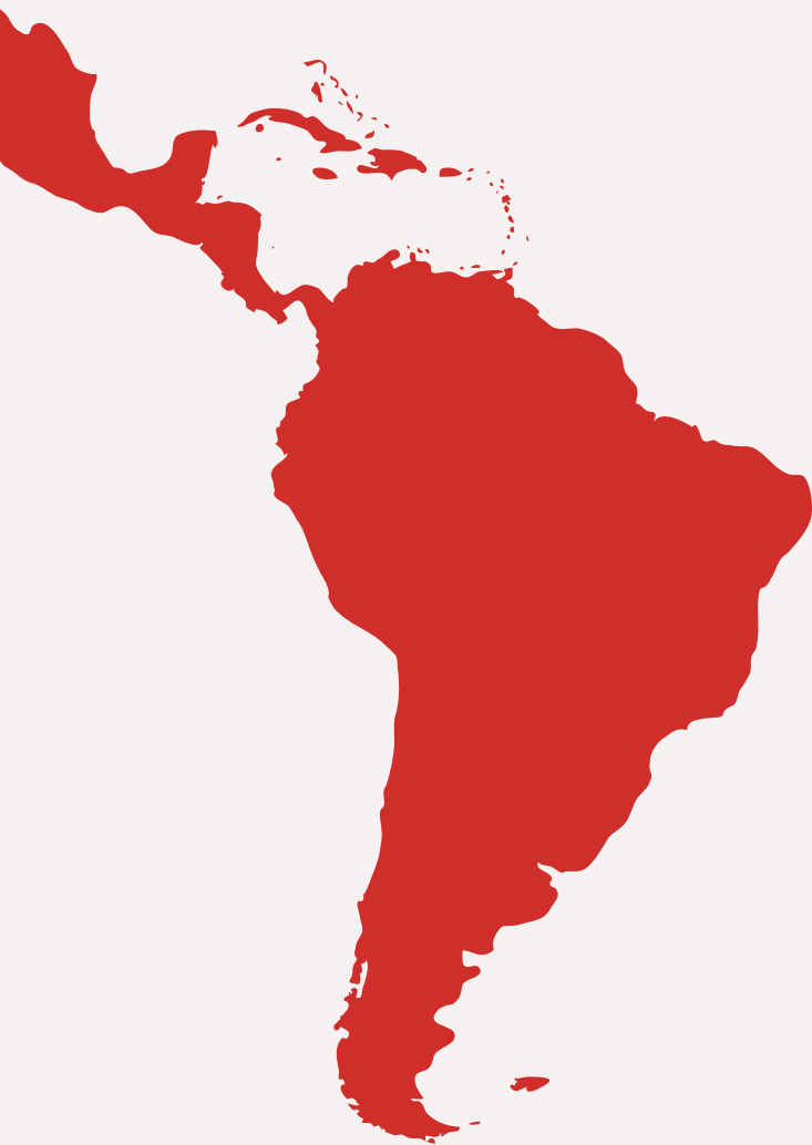
AMÉRIQUE LATINE, CENTRALE ET CARAÏBES