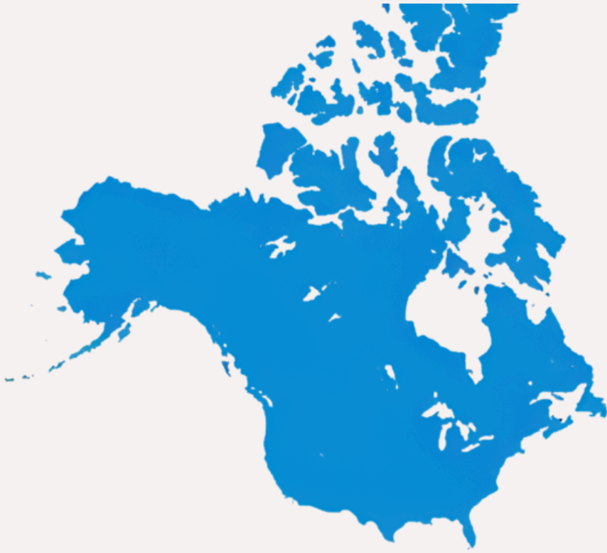
AMÉRIQUE DU NORD